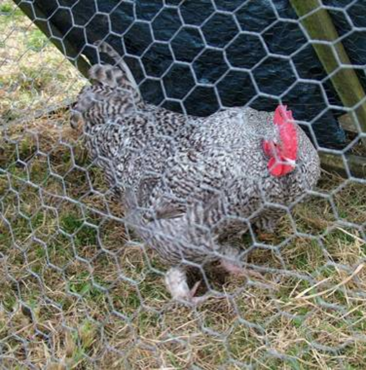
Links: Noord Hollandse Blauwe haan in Engeland, eigenaar Gabrielle Savage.

Rond 1930 kwam dit ras in trek vanwege hun zware lichaamsgewicht, snelle groei, wit vlees en redelijke leg. Hun Nederlandse afkomst betekende dat ze bestand waren tegen de natte omstandigheden die vaak bestaan waar grote aantallen kippen bij elkaar lopen.