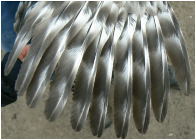
Links: Goede vleugeltekening.