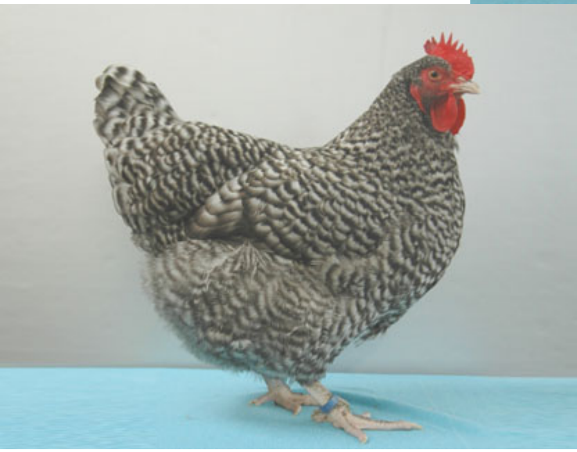
Boven en links: Standaardmatige haan en hen, fraaie showdieren.