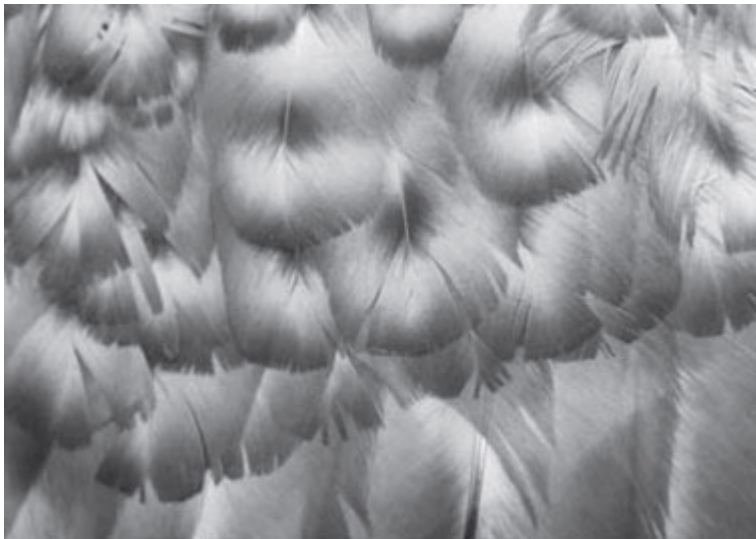
Boven: Verkeerde 'stip'-vormige tekening

Als de genoemde rassen het B-gen (koekoek-c.q. streep-factor) niet zouden hebben, zouden ze gewoon zwart zijn. Dit gen heeft een sterkere invloed op zwart pigment dan op rood of goudkleurig (geel) pigment. Als het B-gen voorkomt bij de wildkleur/patrijkskleur dan maakt het de kleurslag koekoekpatrijs.