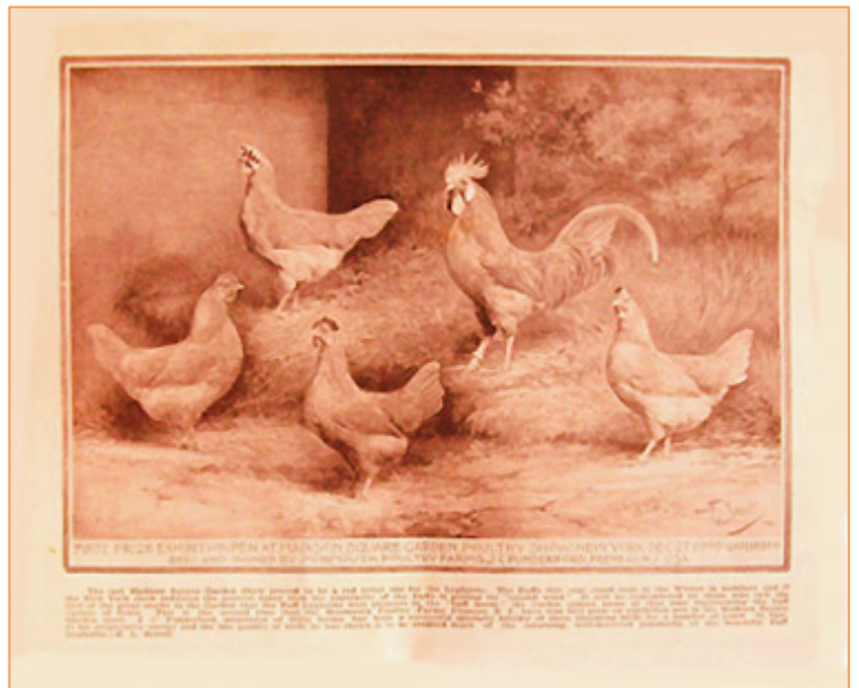
Foto op de volgende blz.: Afbeelding uit RPJ Maart 1911, pagina 74.