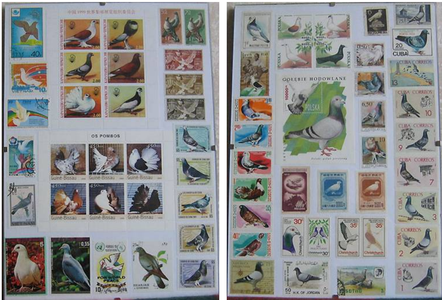
Boven: Postzegels uit diverse landen.

Ik heb ook een aantal Luciferdoosjes (etiketten) . Ze komen uit Holland (2 series), Polen, Rusland en Joegoslavië. Deze worden ook door heel veel mensen verzameld en bestaan met allerlei afbeeldingen.