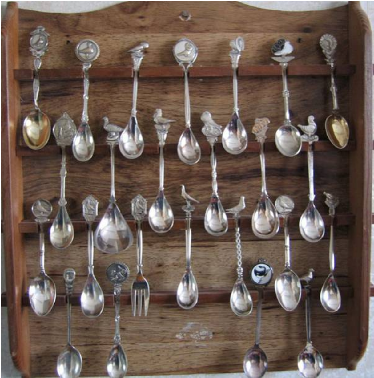
Boven: Een verzameling theelepeltjes.

Deze oude Ereprijskaarten werden gebruikt op shows langs de Schotse grens. Ik heb er een paar uit 1896 tot 1902. Ik weet niet zeker hoe lang ze in gebruik waren. De gekleurde ovale afbeeldingen met een duif werden geplakt op de ereprijskaarten, die gemaakt waren van dik karton en de fokkers hingen zo'n ereprijskaart in hun duivenhok. U kunt zich indenken dat er, gezien het Schotse klimaat, niet veel over is van die kaarten. De firma die deze kaarten drukte heette Ritchies. Behalve zo'n 50 verschillende ovalen met duiven, maakten ze ook ovalen met pluimvee, siervogels en honden. Rond de voorlaatste eeuwwisseling werden er veel shows gehouden in Schotland. Vrijwel elke stad hield een jaarlijkse show.