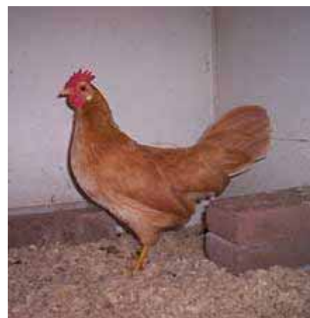
V.l.n.r.: Buff Leghorn kriel (Am. Type) 2007 - Oude Buff Leghorn kriel (Am. Type) 2001 - F3 Wit x Buff hen (Am. Type) 2007 Onder: Buff krielhen (Am. Type) 2007 - Buff Leghorn krielhen (Dutch Type) 2004 - Buff Leghorn krielhaan (Am. Type) 2007.