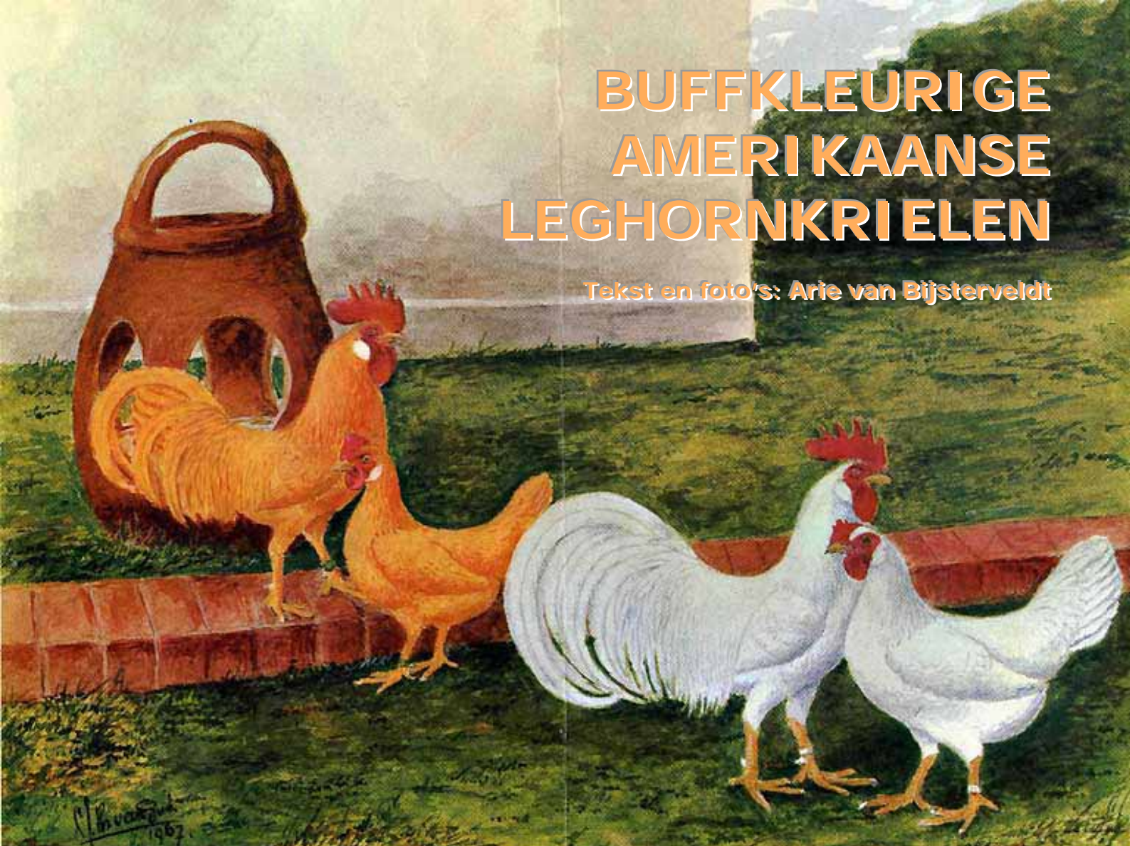
Boven: Tekening van Van Gink 1967.

Amerikaanse Leghornkrielen in de kleurslag Buff zijn bijzonder fraai. Deze kleurslag past uitstekend bij de sierlijke Leghorns met hun gele loopbenen en mooie rode kam als kroon op deze verschijning.