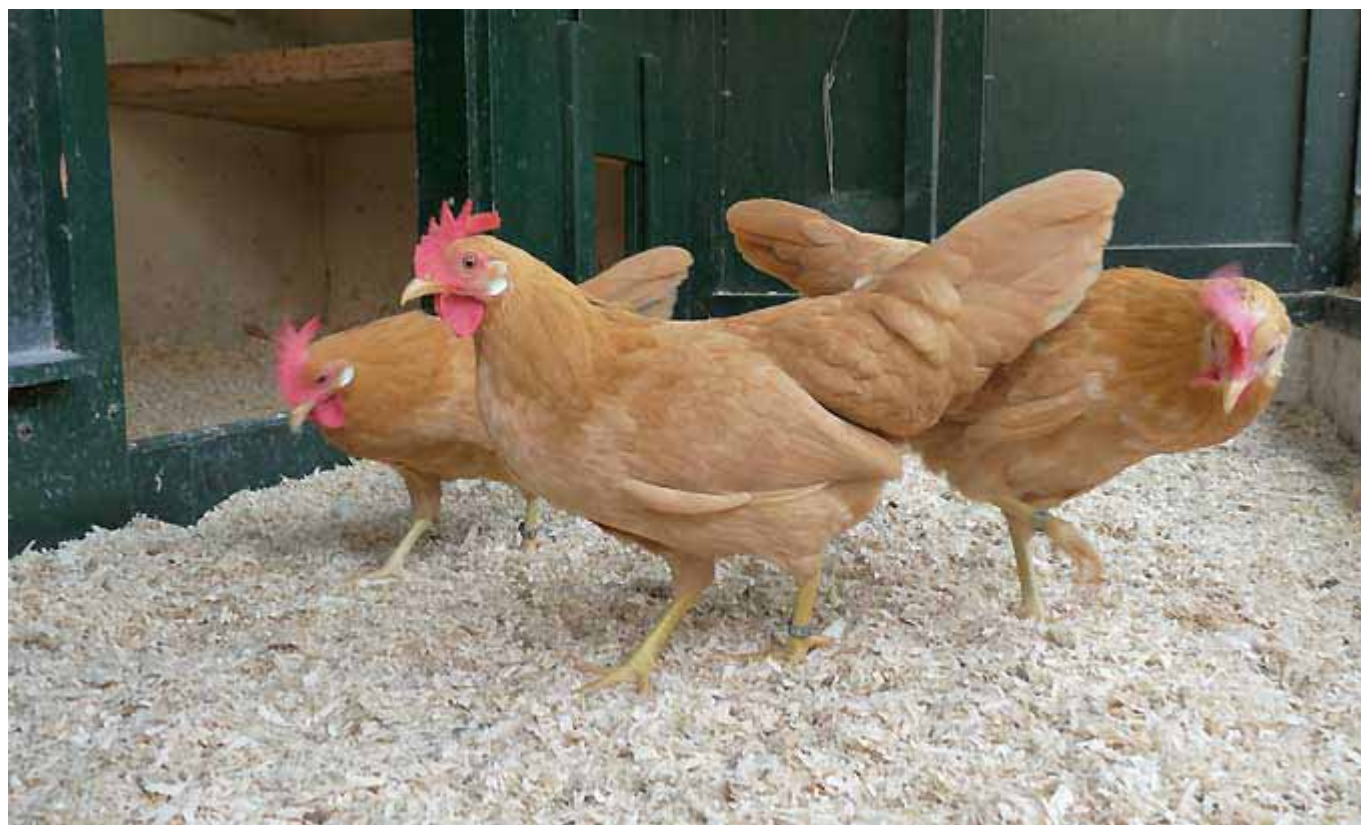
Boven: Jonge hennen broed 2008, F4 uit de kruising wit x buff.

Via een forum op internet The Classroom @ The Coop ben ik in contact gekomen met een paar Amerikaanse fokkers die zelf veel ervaring hebben met de Amerikaanse Buff Leghornkrielen. Ik heb sinds kort contact met de meest bekende fokker uit Amerika Dhr. Danne J.