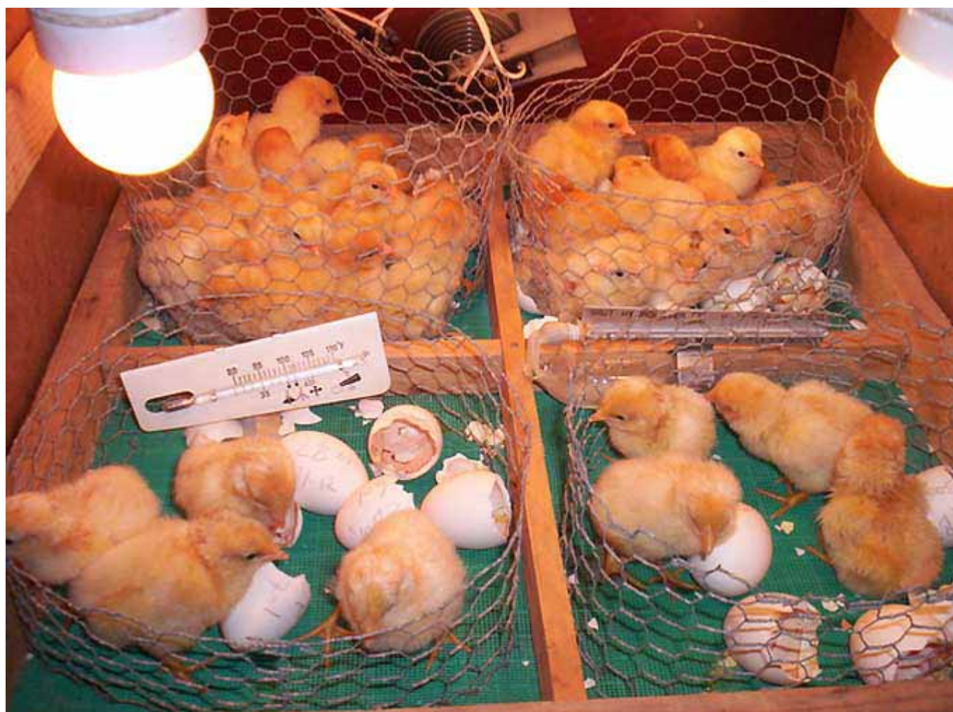
Boven: Kuikens F4 uit diverse ouderparen.

Helaas is het niet mogelijk om eieren of dieren te exporteren en te importeren. Danne en een paar andere fokkers waren zeer geïnteresseerd om met mijn dieren te kunnen fokken. Toen zij erachter kwamen dat ik in Nederland woon en het dus bijna onmogelijk is om materiaal de oceaan over te sturen, is dat een droom geworden.