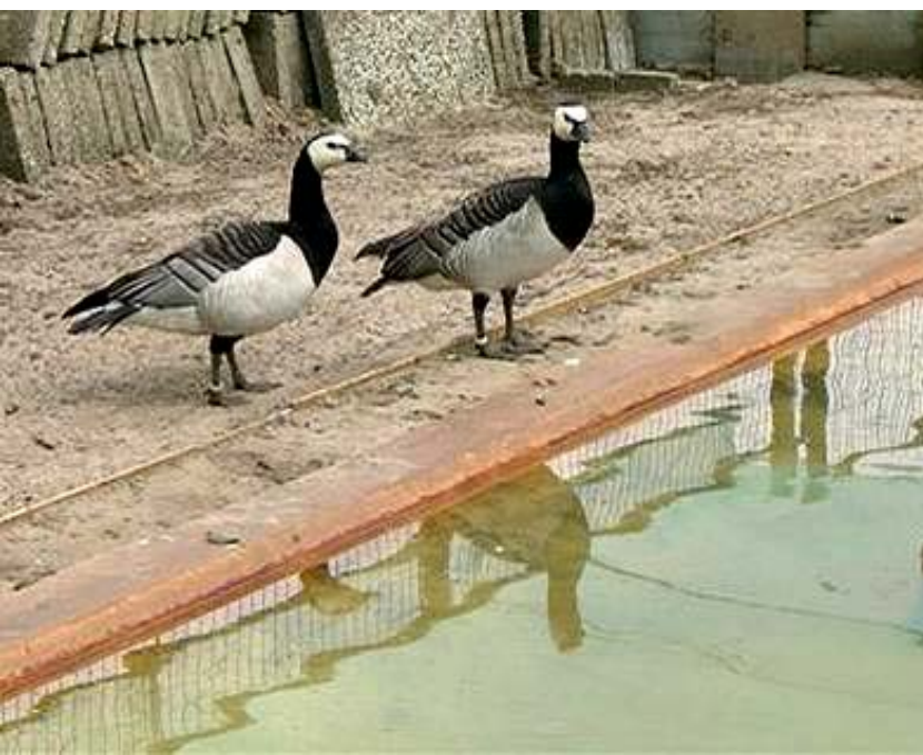
Links: Koppel Brandganzen

Er is ook een vijver voor de Kolganzen en Brandganzen; die lopen bij elkaar. De Brandgans ( Branta leucopsis ) is een kleine ganzensoort. Ze hebben een wit