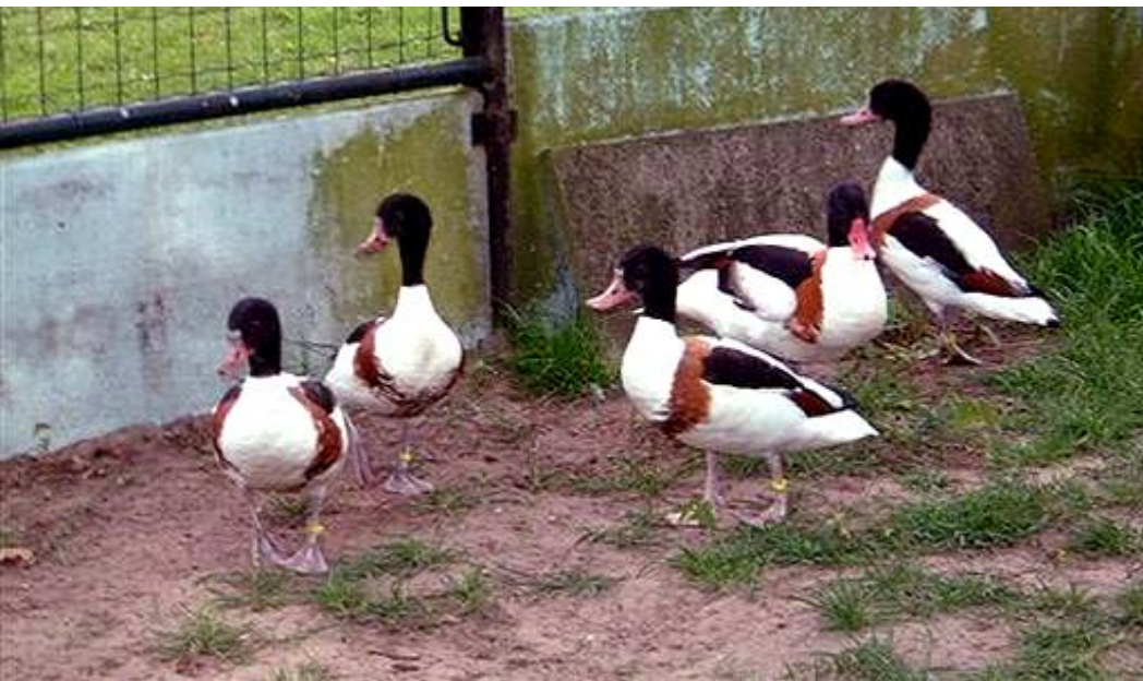
Onder: Jonge berg-eenden van vorig jaar