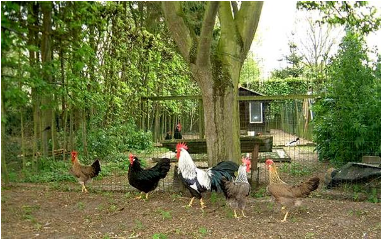
Boven: Zilverpatrijs haan en hen, 2 patrijs hennen en 1 zwarte hen.

Maar u kunt gerust zijn; de huidige Nederlandse Leghorn is weer en kip met alle onderdelen in aanvaardbare afmetingen, sterk en trots, een prachtige kip voor de liefhebber en een ware schoonheid in de tentoonstellingskooien.