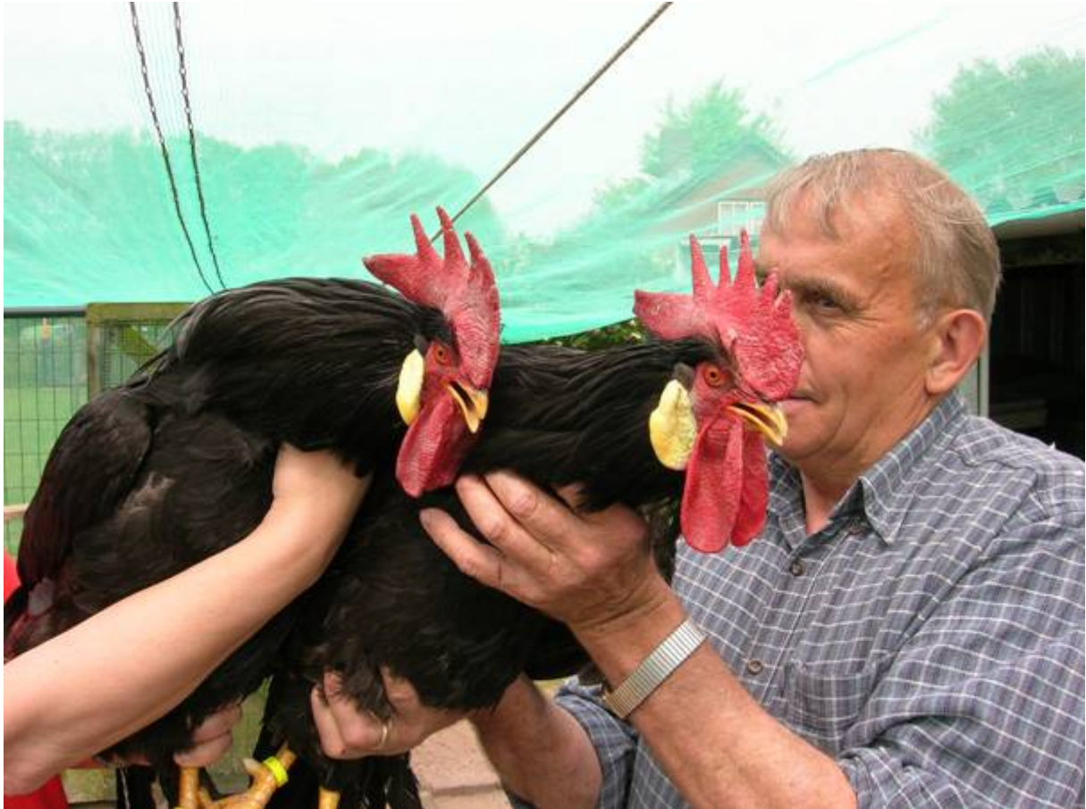
Boven: Twee jonge zwarte Leghorn hanen(broed 2005)

Van origine was de Leghorn maar een kleine kip; dat maakte het ras ook zo bijzonder, want deze tengere kippen legden wél grote eieren! Voor de productiekippen was die kleinheid dan ook een welkom raskenmerk; een goed gefokte en goed verzorgde kleine Leghornhen woog 2 kg., at per jaar slechts 38 tot 40 kg. voer en produceerde 13 tot 15 kg. ei, aldus is te lezen in het Amerikaanse tijdschrift 'The National Geographic Magazine' van april 1927. Dat komt toch neer op 250 eieren van 60 gram!