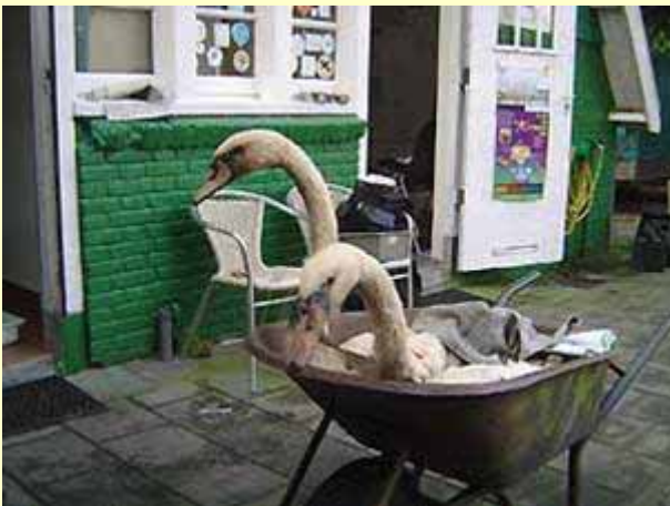
Foto links: Op weg vanuit het opvanghok naar een ander gebouw om daar gewassen te worden.

Foto links: Opvang van met olie bevulde zwanen bij Vogelklas Karel Schot in Rotterdam.