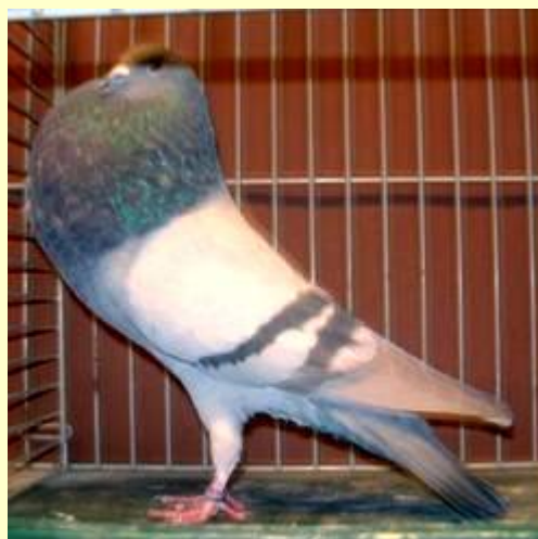
Foto rechts: Een jonge veelbelovende blauw zwartgebantde Horseman kropper.