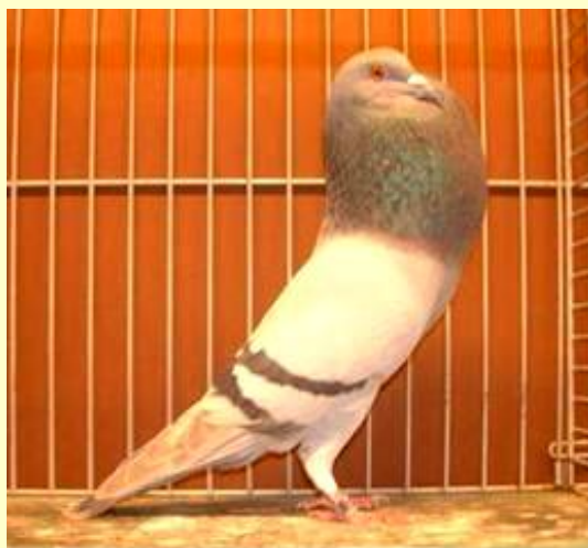
Foto links: Een jonge Horseman duivin in de kleur blauwzilver donkergebant, die hier iets voller zou mogen blazen.

Op vrijdagavond 3 november 2006 hield Rob Sekhuis een boeiende lezing over de Horseman Kropper bij de Eerste Zuid-Hollandse Sierduivenliefhebbers Vereniging (EZHSV) in Den Haag. Hij trof een volle zaal, met een groot en aandachtig publiek. Niet zo vreemd, wanneer je weet dat de Horseman Kropper zoals die in Schotland wordt gehouden, veel overeenkomsten heeft met de Haagse tilduif.